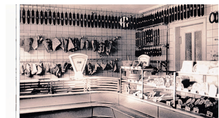
Der Verkaufsraum der Metzgerei in den 50er Jahren.